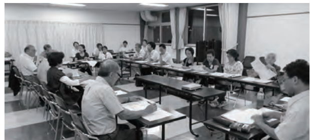
第3回全体検討会の様子