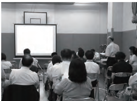
整備構想素案説明会の様子