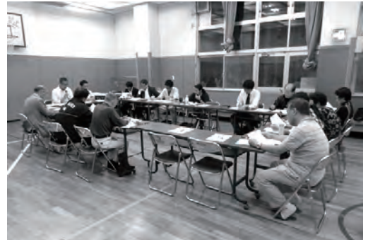
第31回協議会の様子

第31回（平成24年10月11日（木））西小山街づくり協議会では、現在進めている全体検討会や街区別検討会についての報告や協議会が提案した「西小山街づくり構想（案）」を踏まえ、目黒区がとりまとめた「西小山街づくり整備構想」策定についての報告等が行われました。