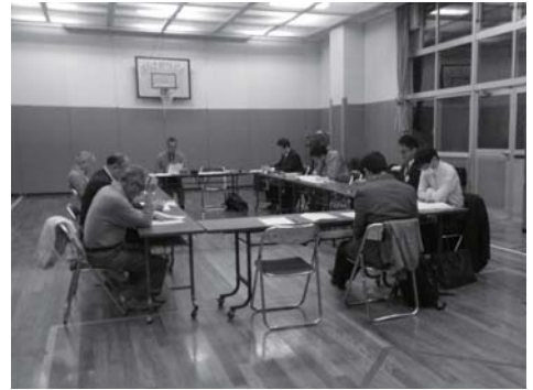
第45回協議会の様子

第43回(平成27年3月19日(木))、第44回(平成27年10月27日(火))、第45回(平成28年3月8日(火))の西小山街づくり協議会では、「西小山地区の街づくりのルール(ソフト面)」について、意見交換をし、ルールの内容や運用方法などを検討しました。