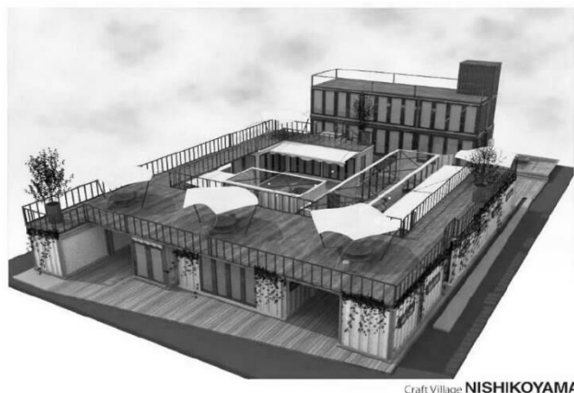
Craft Village NISHIKOYAMA

7番・8番地区の街なか賑わいエリアでは、UR都市機構と株式会社ピーエイによる「地域まちづくり支援事業」として整備・運営されるクラフトビレッジ西小山が昨年11月にオープンしました。待望の施設は、「with コロナ」にふさわしい開放的な空間と、地域と連携した企画等により、新たな交流を生み出しています。