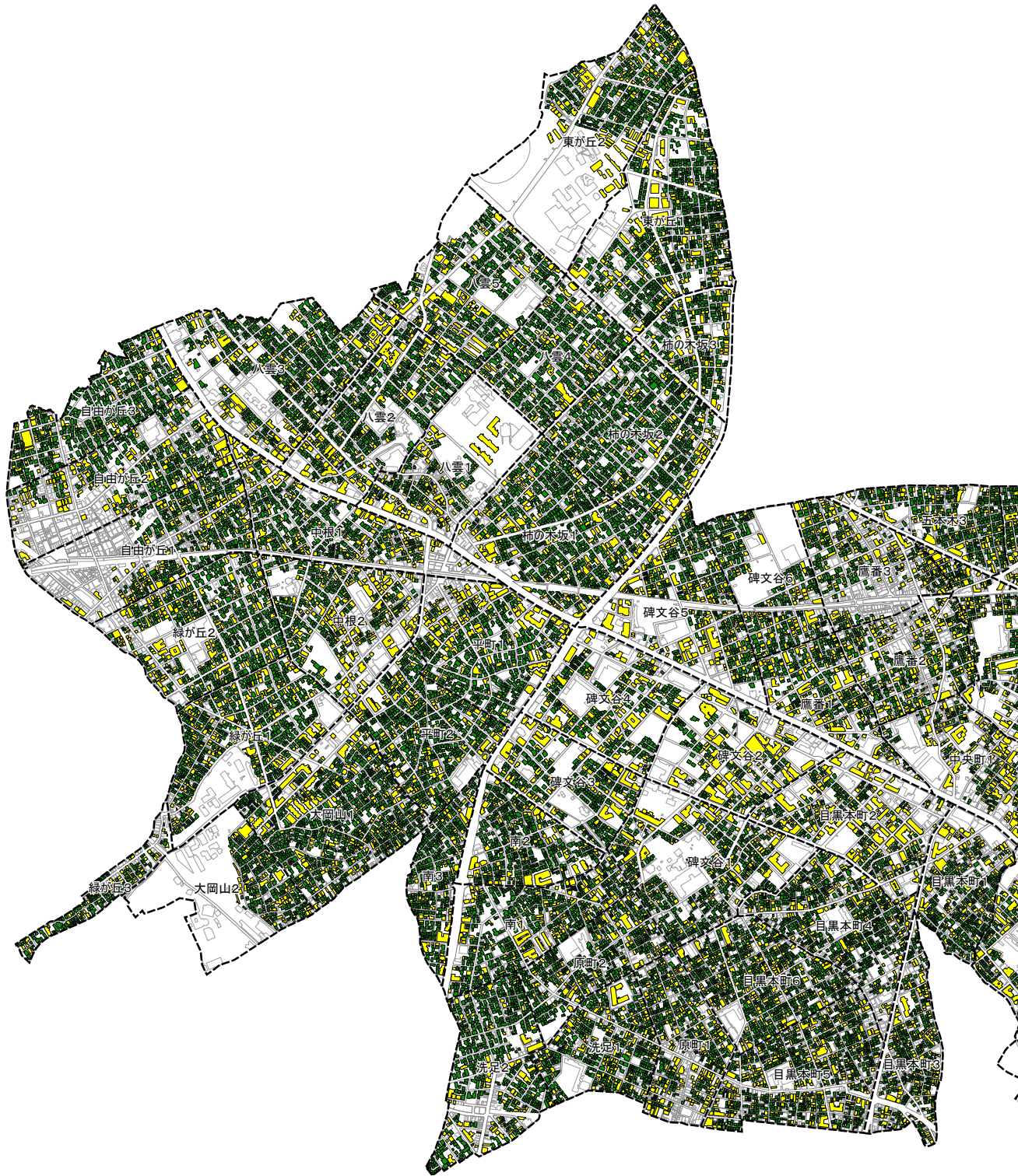
用途別建物の分布（住宅：平成 28 年）

集合住宅は、独立住宅と同様にほぼ区内全域に分布しています。また、区北部及び東部において、比較的規模の大きな集合住宅が立地しています。