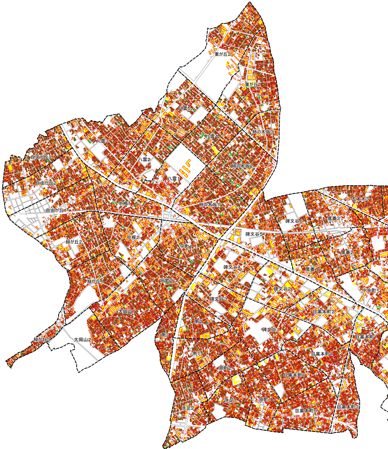
用途別建物分布の推移（住宅：平成23年～平成28年）