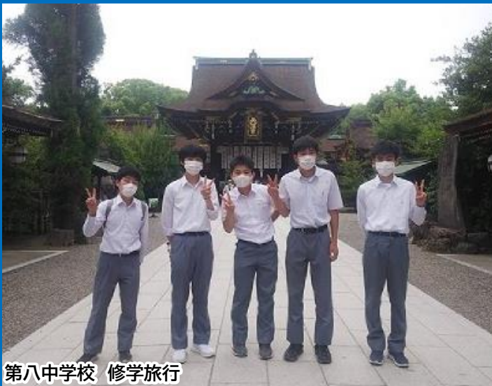
第八中学校 修学旅行