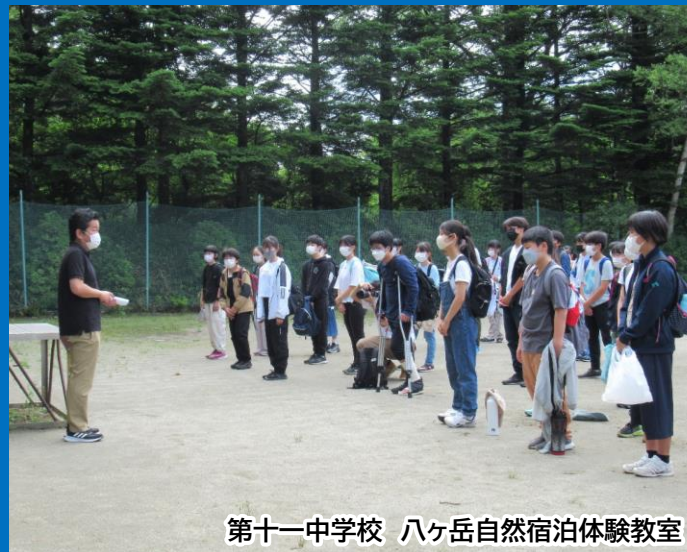
第十一中学校 八ヶ岳自然宿泊体験教室