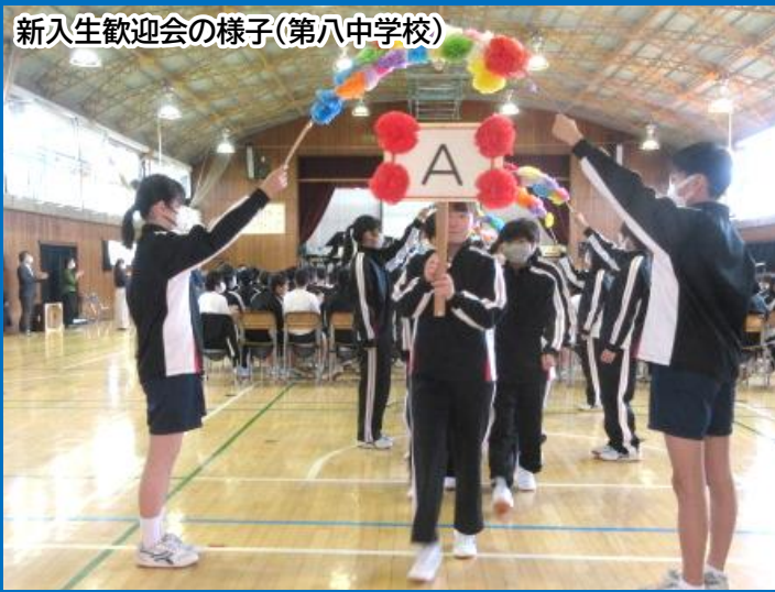
新入生歓迎会の様子(第八中学校)