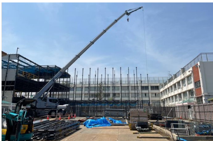
▲鉄骨建方工事の様子

興味深く観察している姿も見受けられます。近隣のみなさまにはご迷惑をおかけいたしますが、引き続きご理解とご協力をよろしくお願いいたします。