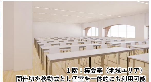
1階：集会室（地域エリア） 間仕切を移動式とし個室を一体的にも利用可能