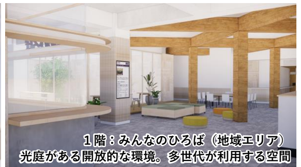
1階：みんなのひろば（地域エリア） 光庭がある開放的な環境。多世代が利用する空間