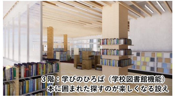
3階：学びのひろば（学校図書館機能） 本に囲まれた探するのが楽しくなる設え