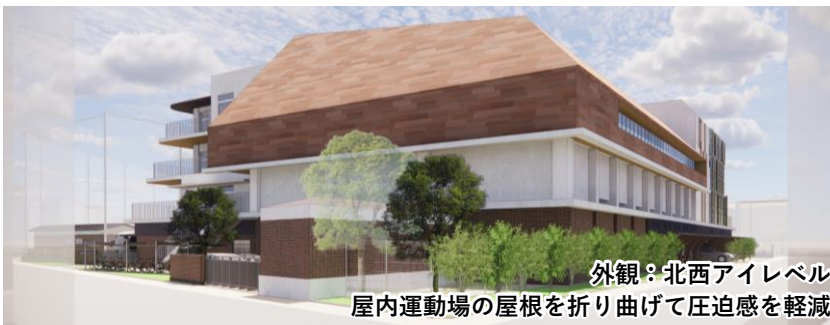
外観：北西アイレベル 屋内運動場の屋根を折り曲げて圧迫感を軽減