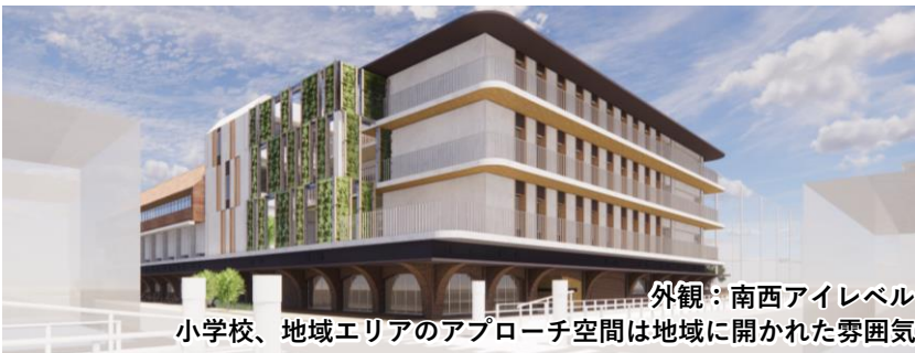
外観：南西アイレベル 小学校、地域エリアのアプローチ空間は地域に開かれた雰囲気