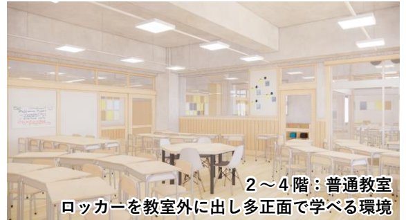
2～4階：普通教室 ロッカーを教室外に出し多正面で学べる環境