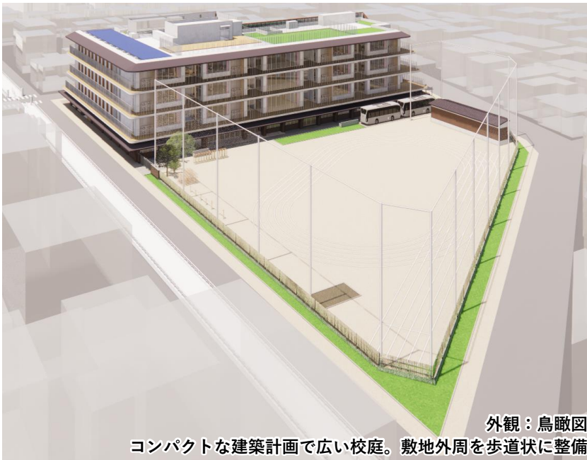
外観：鳥瞰図 コンパクトな建築計画で広い校庭。敷地外周を歩道状に整備

第6回地域懇談会で構成員の方々と共有した新校舎の屋外・屋内の完成イメージをご紹介します。