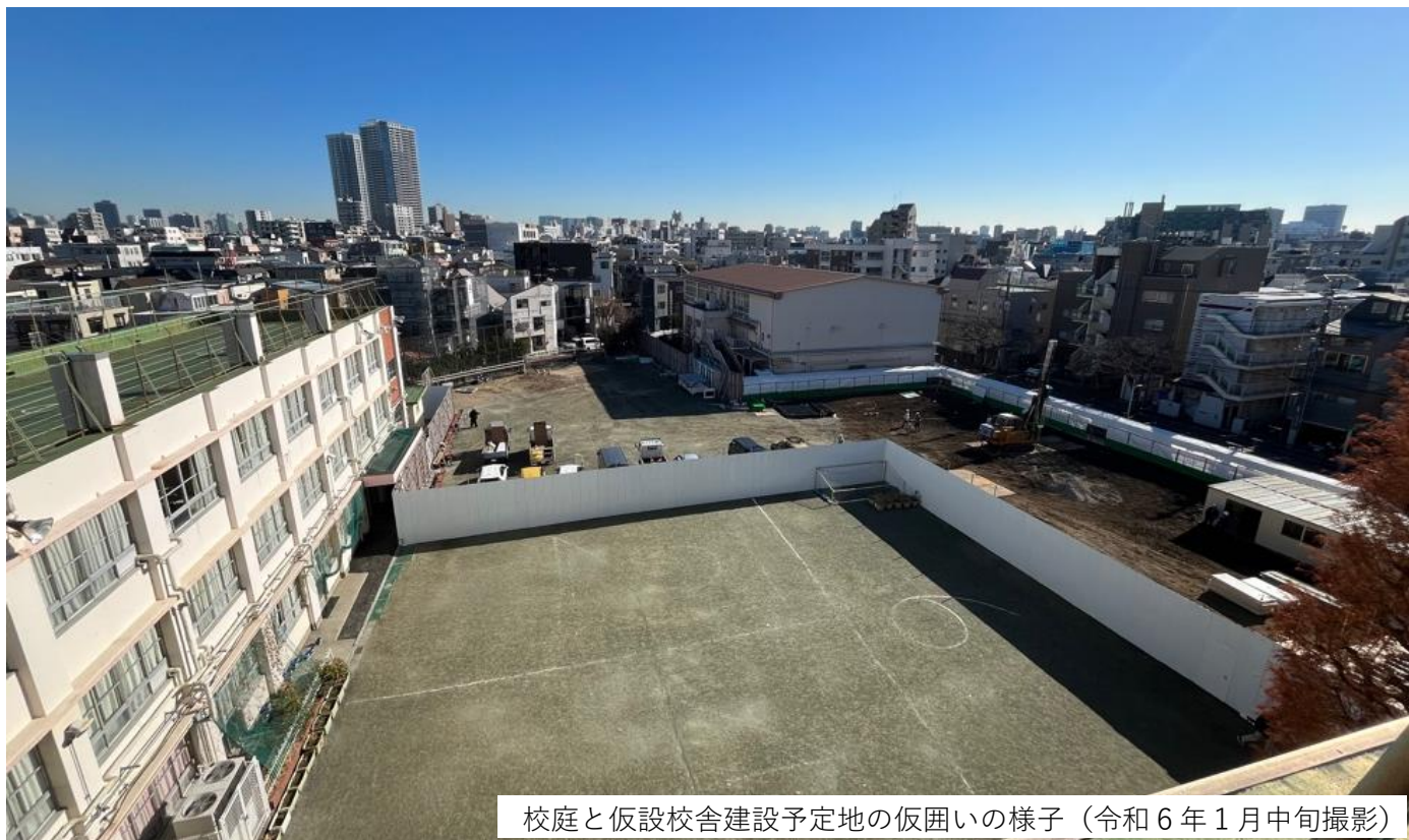
校庭と仮設校舎建設予定地の仮囲いの様子（令和6年1月中旬撮影）