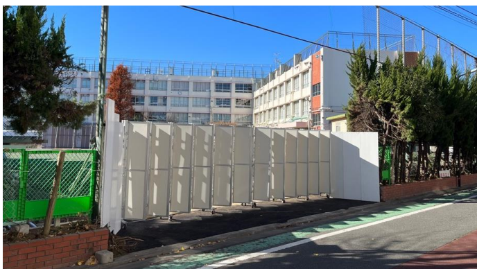
▲工事用出入口ゲート（東側道路）