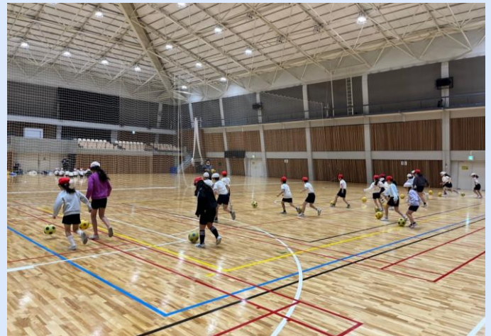
▲中央体育館アリーナ

令和6年1月から、中央体育館を利用して体育の授業を実施しています。広い体育館でのびのびと体を動かしています。