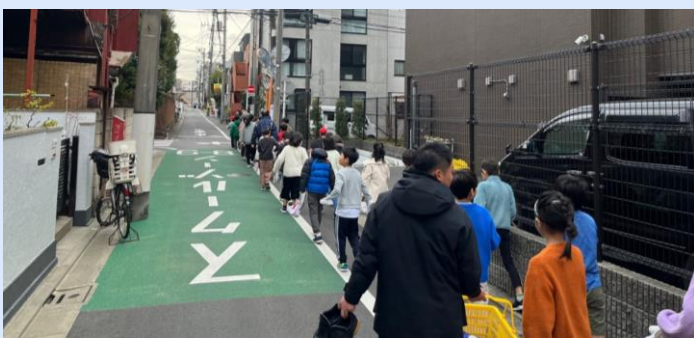
▲中央体育館への移動