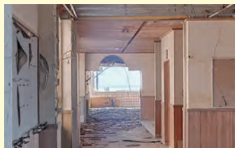
震災遺構 中浜小学校