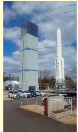
台山公園 スペースタワー・コスモハウス