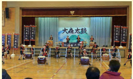
2月25日に閉校した枝野小学校 新5・6年生で行う最初で最後の大森太鼓の演技発表