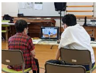
【オンラインによるフレイル予防の様子】

オンラインを利用した介護予防教室を実施。オンラインに不慣れな方、初めての方でも参加しやすいよう、事前にオンライン操作説明会を実施している。