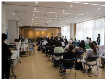
めぐろ福祉しごと相談会の様子