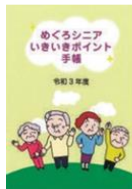
めぐろシニアいきいきポイント手帳