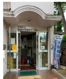
住区センターでの出張相談会

令和2年度から3年度にかけては、新型コロナウイルス感染症の影響により、出張相談及び地域ケア会議の開催回数が減、また各種講座やイベントが中止となった。