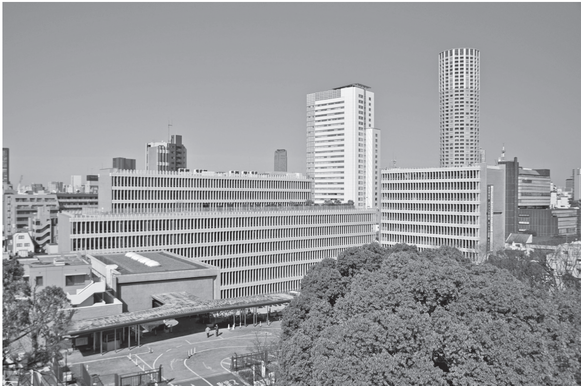
めぐろく そうごうちょうしや 目黒区総合庁舎 Meguro City Office Complex 目黒区综合庁舎 메구로구종합청사

Blossoming Sakura, a pleasant town, always Meguro