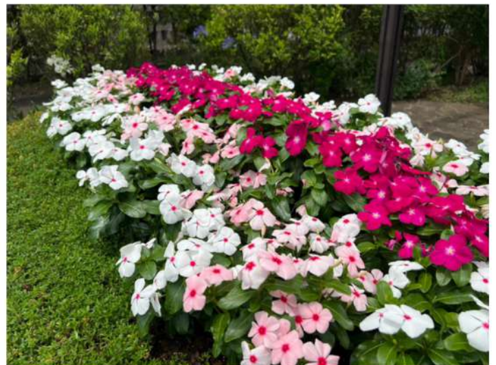
ペンネーム : し の つ び

目黒天空庭園には、しぜんがいっぱいでいろいろな食べ物を植えているところもあります。こんなしぜんにやさしい庭園はなかなかないと思います。みなさんぜひ行ってみてください。