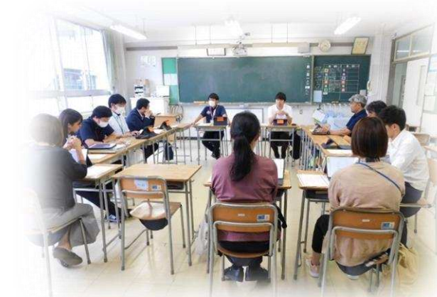
第八中・第十一中