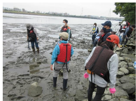
<活動体験「ごみ拾いと生きもの観察」の様子>