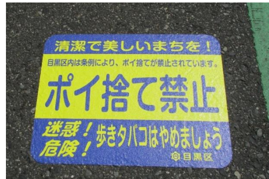
<路上喫煙禁止区域外に掲示した啓発シート>