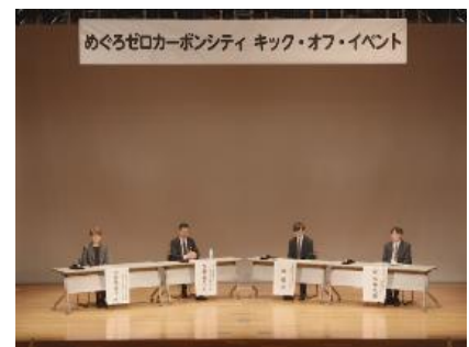
<めぐろゼロカーボンシティ キック・オフ・イベント>

地球温暖化対策のために、一人ひとりが実践することができる省エネ・省資源の取組を区報や区ホームページで紹介する等の普及啓発を行いました。さらに、2022（令和4）年2月に、区が2050（令和32）年ゼロカーボンシティの実現を目指すことを表明したことをふまえ、「めぐろゼロカーボンシティ キック・オフ・イベント」を開催しました。