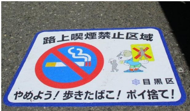
<路上喫煙禁止区域内に掲示した路上喫煙禁止シート>