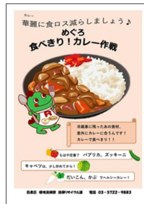
<カレー作戦ポスター>

「めぐろ食べきり！カレー作戦」キャンペーン実施や食べきり協力店での啓発品の配布、フードドライブ実施支援として区民団体等へのぼり旗や食品回収用ボックスの貸出