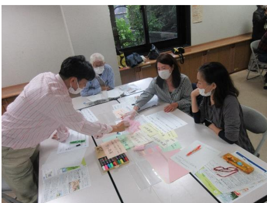
<グループワーク「食品ロス対策メニューの作成」の様子>