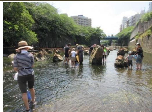
<目黒川で魚を探す区民参加者>