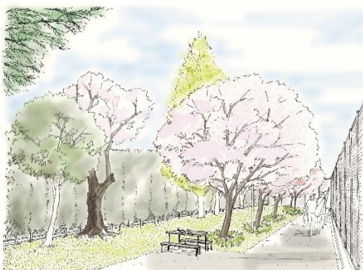
<碑文谷公園の植替えイメージ> 今ある桜を保全しつつ、段階的に世代交代を行うエリア