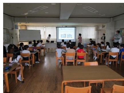
＜鷹番小学校でのビオトープ講義＞