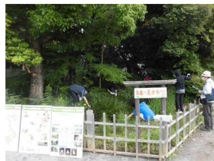
＜五本木小学校でのビオトープ管理活動＞

五本木小学校では、児童が、生物多様性とビオトープについて学ぶ活動を行い、鷹番小学校では、区職員により児童へ学校内にあるビオトープについての講義を行いました。