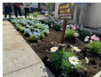
<グリーンクラブが手入れした花壇>

96団体に花苗を配布したほか、各住区のイベントなどで参加者にキンモクセイやアジサイ、ハギなど、合計1,100本の花苗を配布しました。