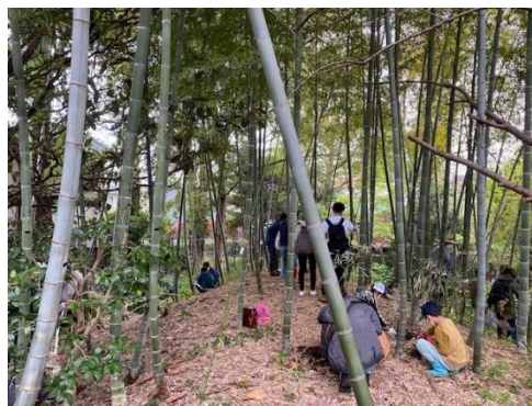
<住民参加による公園管理>

公園の管理には、住民ボランティアが関わり、花壇、雑木林、土壌、生物の生息環境の向上に寄与する質の高い公園管理を目指し、9つの公園で20団体が住民参加による公園管理を行いました。