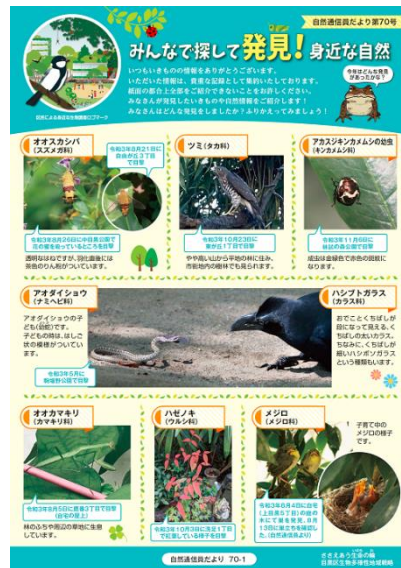
＜自然通信員だより第70号より＞