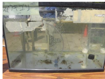
＜スミウキゴリ：目黒川＞