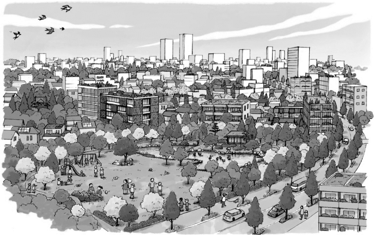
(イラストはイメージです)

こうした将来像を目標に、みどりの拠点となる公共施設等の緑地の保全、公園や緑道の整備、道路、河川沿川の緑化を進めるとともに、区民、事業者と協働して住宅地をはじめとする民有地の身近なみどりの保全や創出、育成に取り組み、まちに点在する樹林地や公園から住宅の庭までつながるエコロジカルネットワークを形成します。