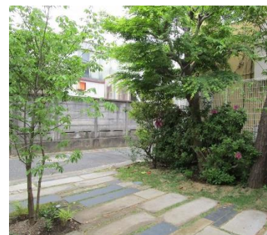
<道路沿い緑化の例>