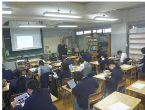
校章デザイン教室の様子

応募されたデザインについて、生徒・児童投票を実施し、以下のデザインを目黒西中学校の校章図案に決定しました。今後、採用された生徒の意見を聞きながら、デザイナーにより、校章として完成させる予定です。