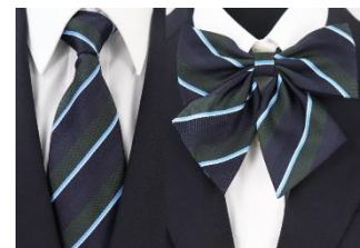
ネクタイ・リボン