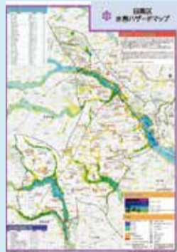
▲目黒区水害ハザードマップ

水害ハザードマップで、自宅周辺の浸水予想区域・土砂災害警戒区域や地域避難所を確認しましょう。子どもや高齢者がいるなどで移動が困難な場合、2階以上の頑丈な建物であれば家にとどまる在宅避難の方が安全な場合もあります。事前に検討しておくことが大切です。