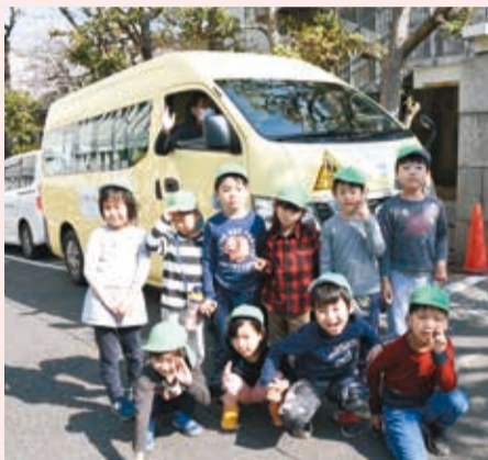
▲園児にも大人気のヒーローバス