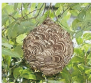
▲危険性が高いスズメバチの巣