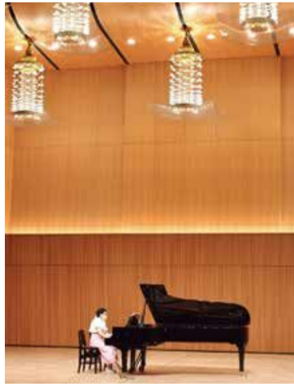
▲姉妹仲良くピアノを弾き、思わず笑顔がこぼれます

家は電子ピアノのため、本物のピアノの音に触れられるレッスンが楽しみでしたが、コロナのためレッスンがオンラインになり、残念に思っていました。でも、災いが転じて、こんな貴重な機会をいただき、本当に感謝です。