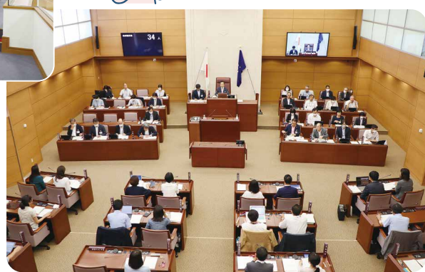
▲傍聴席から見る議場