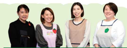
▲ほ・ねっとひろば職員