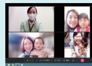
▲月1回の編集会議は、感染症対策のためオンラインで開催

子育て中は孤独を感じることもあり、知り合いが欲しく編集員に参加しました。月に1度の編集会議では、先輩ママの子育て情報が聞けたり、職員のかたが相談に乗ってくれたり、私にとって仲間づくりの場になっています。子育て中のかたは誰でも参加できるので、一緒に参加できる仲間を待っています。