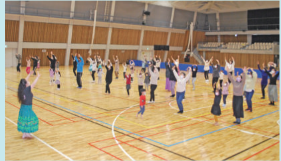
▲3年の親子フラダンス体験会の様子