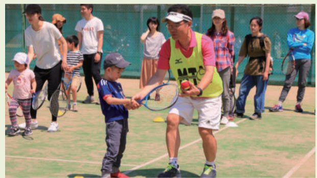
▲平成30年の親子ふれあいテニスの様子