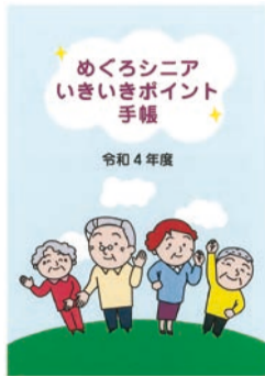
▲サポーター登録者に、ポイントを記録する手帳を配布します