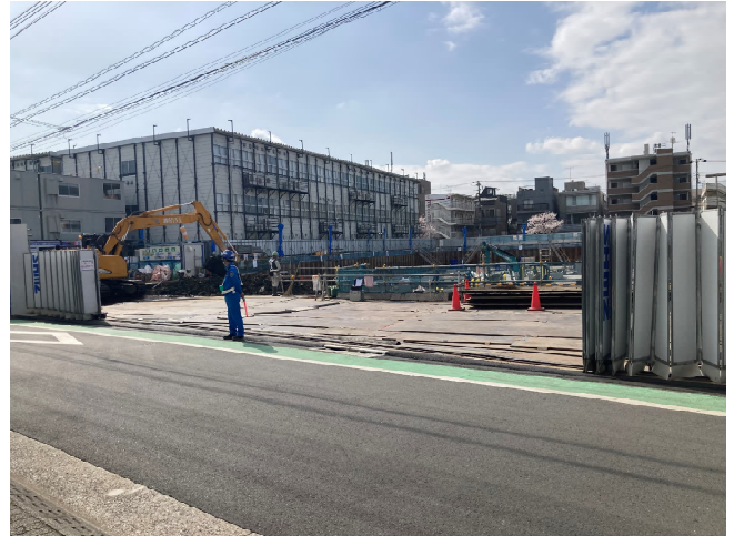
▲建設工事のイメージ②（工事車両搬入出口）