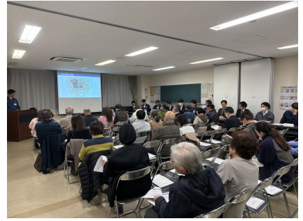
▲工事説明会の様子