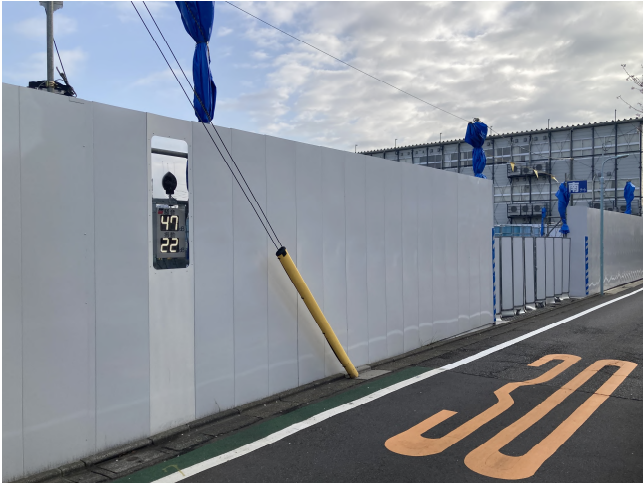
▲建設工事のイメージ①（仮囲い・騒音振動計）