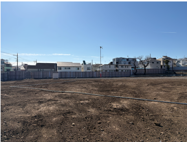
▲既存校舎解体後の様子（令和8年2月）