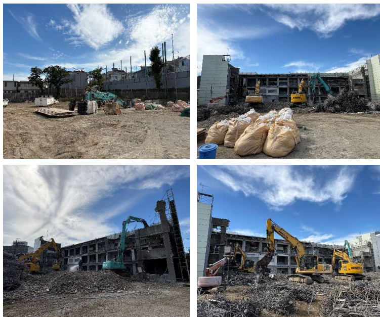
▲既存校舎解体の様子（令和7年9月）

目黒南中学校建替えに関して、ご意見・ご質問等がございましたら、下記までご連絡ください。