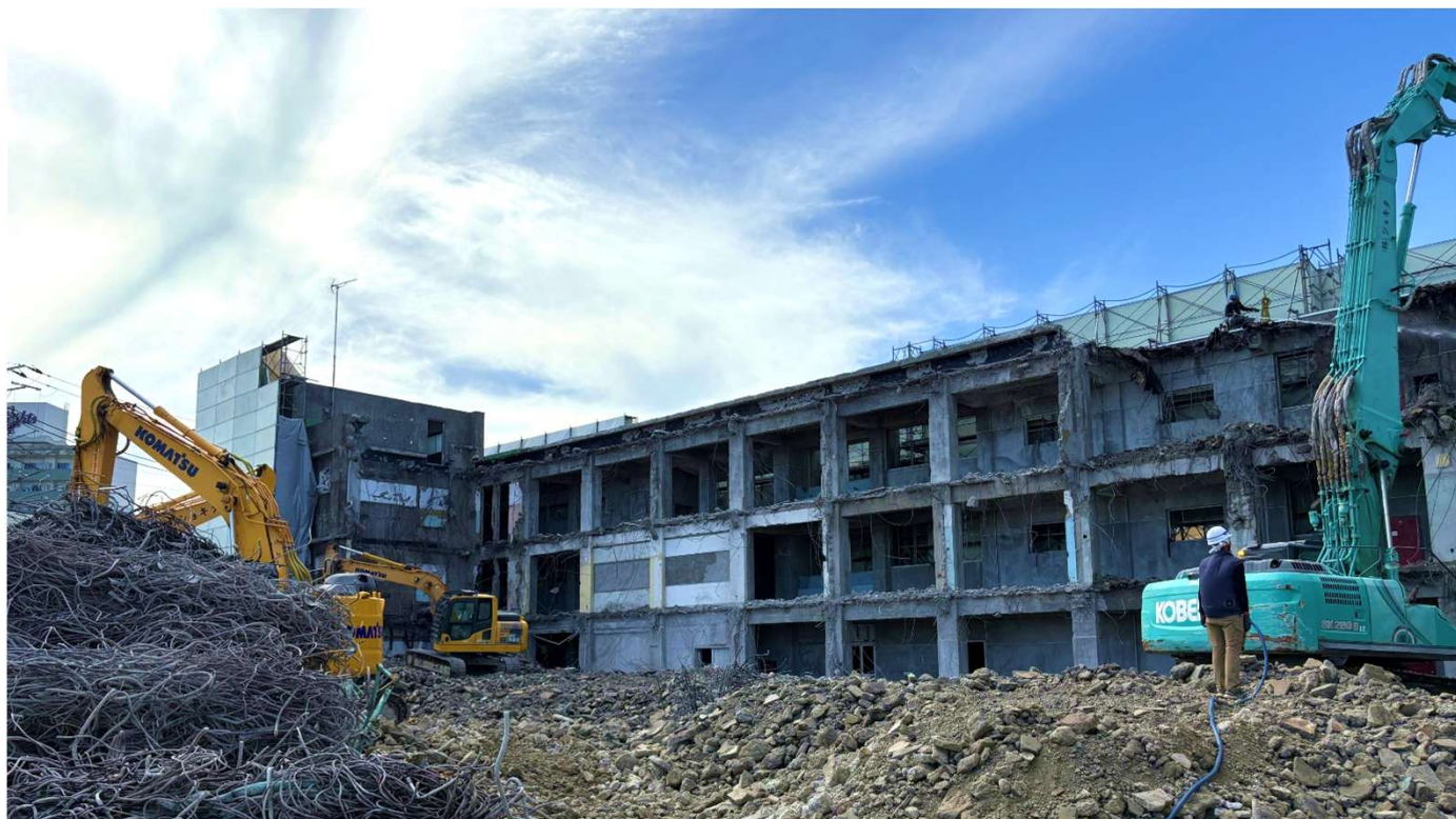
▲既存校舎解体の様子（令和7年9月）

現在、地上部分の躯体を解体中です。解体工事は令和7年12月頃まで実施する予定です。工事期間中、近隣の皆様には大変ご不便とご迷惑をお掛けし誠に申し訳ございません。引き続きご理解とご協力をよろしくお願い申し上げます。