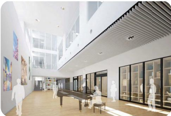
▲コミュニケーションラウンジ