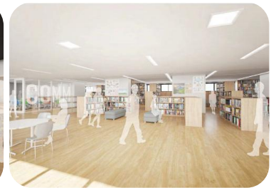
▲ラーニングセンター

詳しくは目黒区公式ウェブサイト 「目黒区立目黒西中学校新校舎実施設計」 をご覧ください。