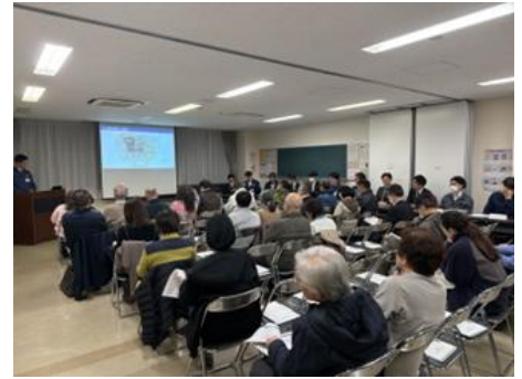
▲(参考)目黒南中工事説明会の様子

中根住区センター1F コミュニティールーム101・102 住所：大岡山1-37-2