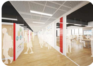
▲ホームベース・教室