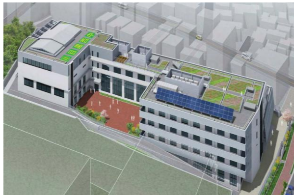
▲新校舎外観イメージ