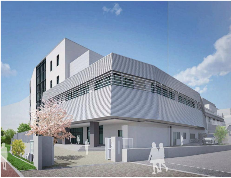
▲新校舎外観イメージ

新校舎の建設工事に先立ち、工事内容や安全対策、今後のスケジュールなどについてご説明するため、工事説明会を開催いたします。