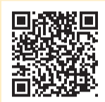
◀めぐろパパの 詳細はこちら