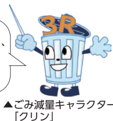
▲ごみ減量キャラクター「クリン」