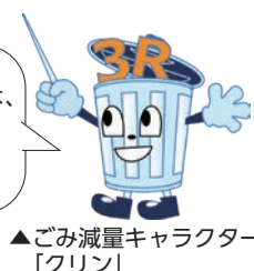
▲ごみ減量キャラクター「クリン」