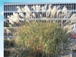
▲総合庁舎のススキ