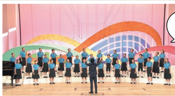
東山小学校合唱団

団員を代表して6年生が受賞報告のために区役所に来庁し、喜びの声を伝えてくれました。これからも、すてきな歌声を届けてくれることを期待しています。