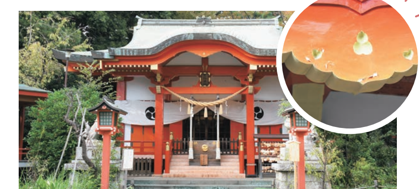
◀神社のシンボルの三本の八咫鳥を手水舎に飾ってあります

自由が丘駅からほど近くにある熊野神社。本殿にあるハートのデザインを見つけることができると、恋愛運が上がるというひそかな人気スポットです。限定で御朱印のデザイン(下写真)がハートの中に八咫鳥(やたがらす)の時があります。その他にも、人形の中におみくじを入れたものなど、自由が丘らしいおしゃれなお守り等もあり、デートスポットとしてもおすすめです。