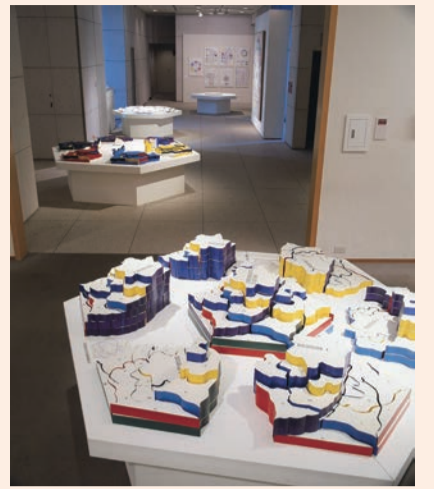
宇佐美圭司 (Ghost Plan in Process : Profiles) 1972年、アクリル塗料・木、目黒区美術館蔵、目黒区美術館での展示風景(1992年)

目黒区美術館は昨年11月に開館35周年を迎えました。 昨年の展覧会「コレクション解体新書Ⅰ」に続く第2弾として、所蔵作品の中から、李禹煥、高松次郎、宇佐美圭司、村上友晴、川俣正などの作品を取集経緯やエピソードをまじえながら紹介します。