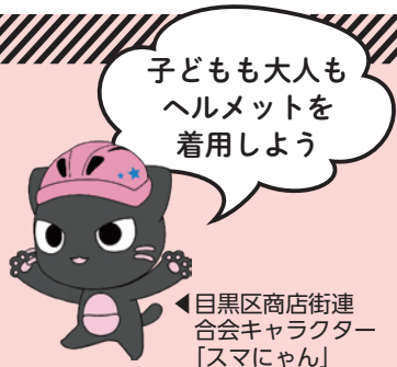
目黒区商店街連合会キャラクター「スマにゃん」

4月1日から、道路交通法と区の条例の改正により、全ての自転車利用者の乗車用ヘルメット着用が努力義務化されます。