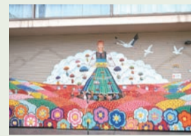
▲平和の壁画(区民センター公園)

育所等に通えない子どもを、仕事などで保育できない保護者の代わりに、専門施設で一時的に保育を行うサービスです(事前登録が必要)。施設に予約の上、登録してください。施設は、今後も整備予定です。詳細は区(コード8)をご覧ください。お問い合わせください。