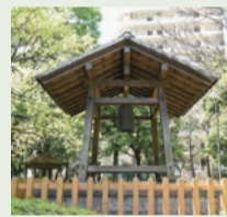
▲めぐる平和の鐘(区民センター公園)