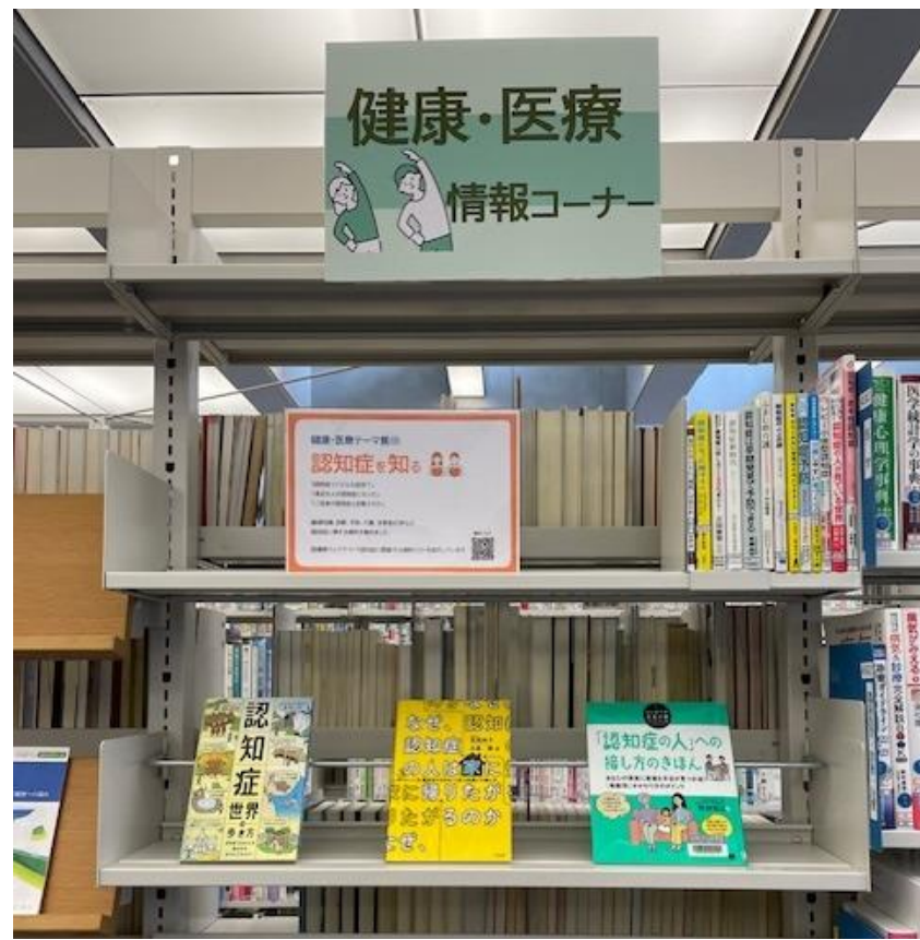
「健康めぐろ21」の展示コーナー