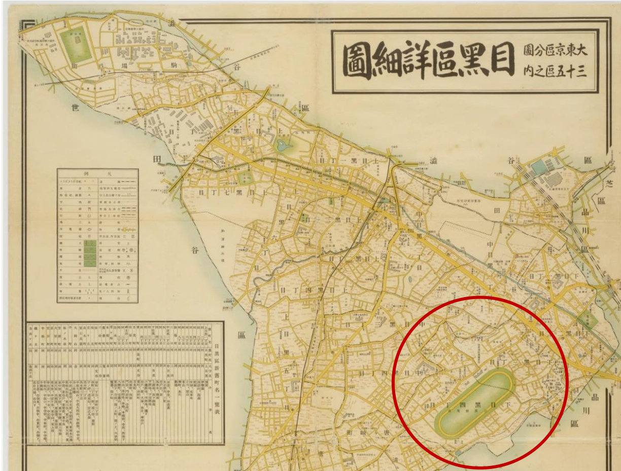
昭和8 (1933) 年