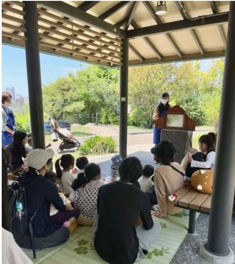
青空おはなし会の様子（天空庭園）