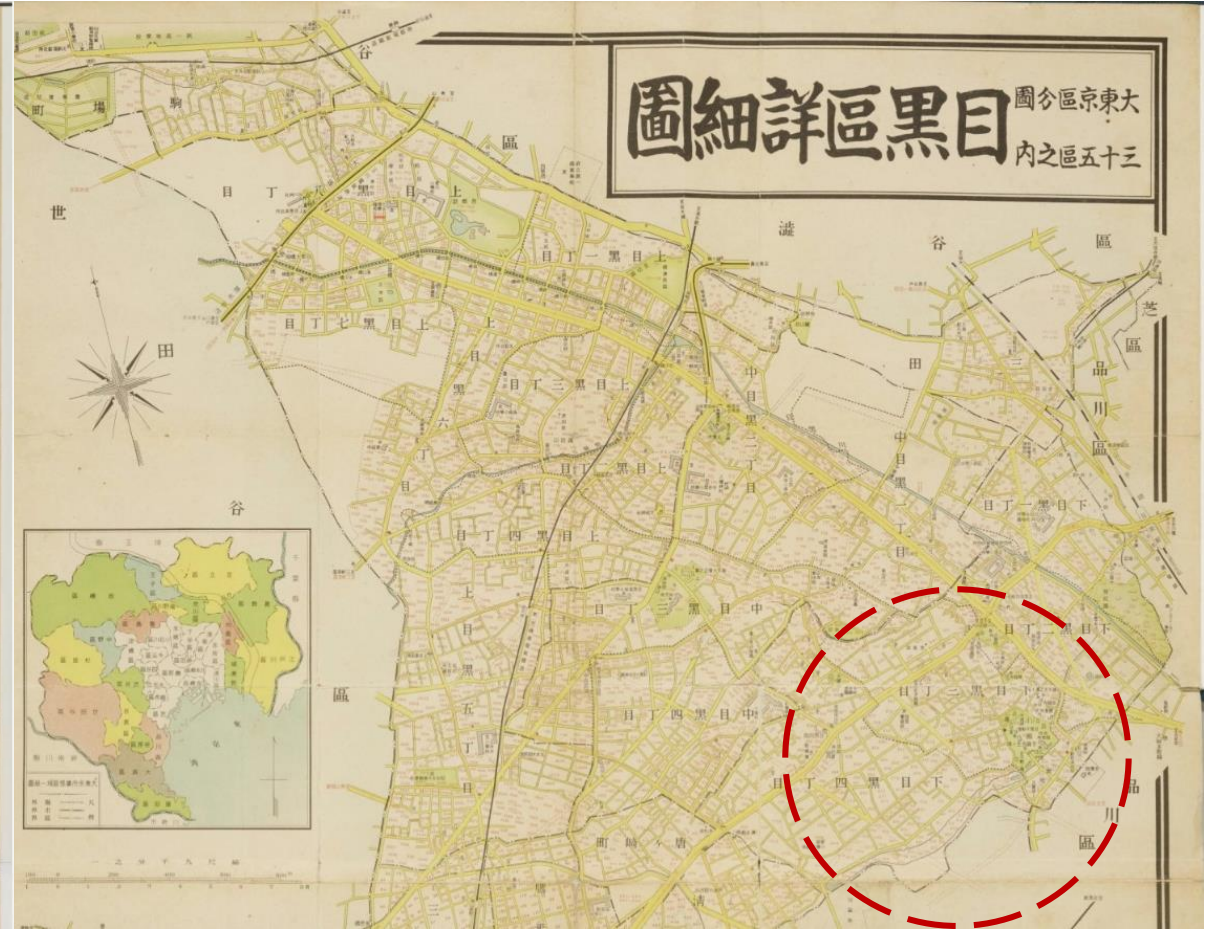
昭和12 (1937) 年