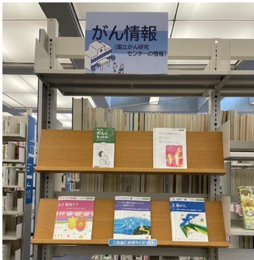
がん情報センター提供の資料