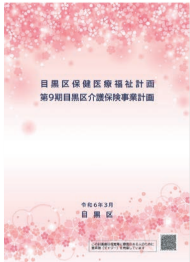
冊子は介護保険事業計画と合冊です

図健康福祉計画課保健福祉計画係 (☎5722-9406、 ☎5722-9347)