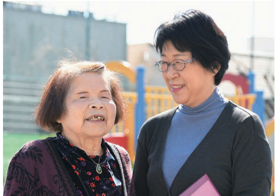
▲区民のかた(左)と民生委員(右)