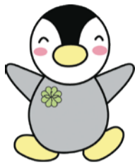
▲民生委員・児童委員の公式キャラクター「ミンジー」

児童福祉に関することを専門的に担当し、子ども家庭支援センターや児童相談所・学校・児童館などと連携して、子どもの健全育成活動や子育て支援活動をサポートしています。4月1日現在、19人が活動しています。