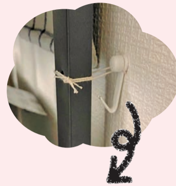
棚が倒れないように固定