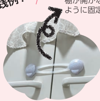
棚が開かないように固定