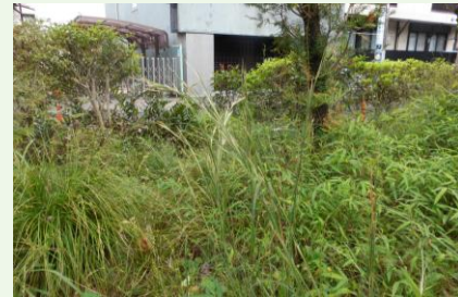
メリケンカルカヤ