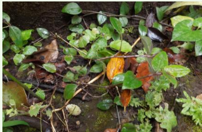
ノハカタカラクサ