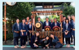
▲目黒門前囃子保存会の皆さん

区民の皆さんへのメッセージを伺うと、「おはやしの笛や太鼓の音に足を止めて耳を傾けてほしいです」と、実際に音に触れ楽しんでもらうことを、皆さん何より望んでいらっしゃいました。