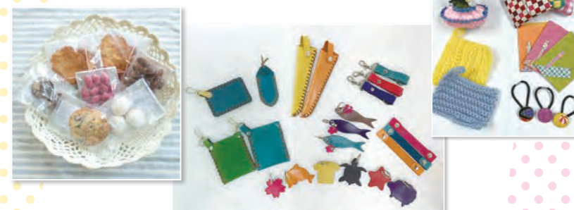
図10:30~(無くなり次第終了)

区公式YouTube「めぐるTV」で、障害福祉施設の紹介動画「なぽぽの散歩」(コード⑤)をご覧ください。