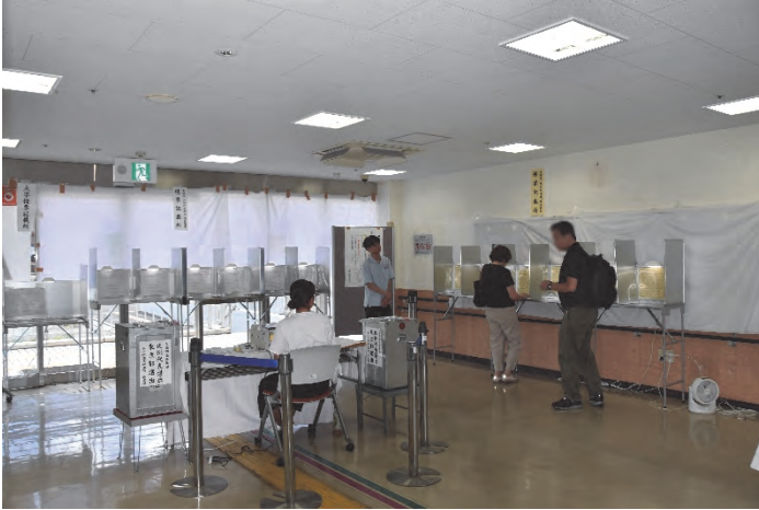
（スマイルプラザ中央町）