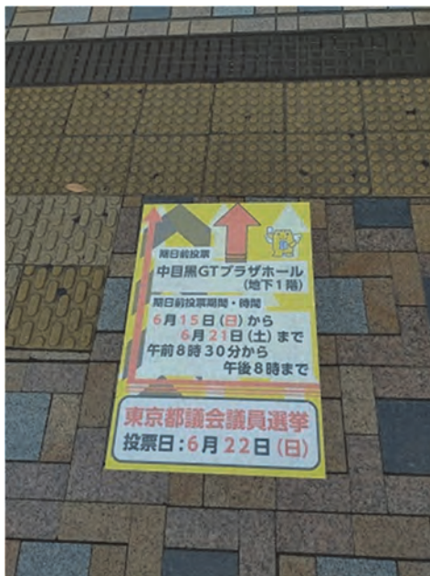
(中目黒GTプラザホール)