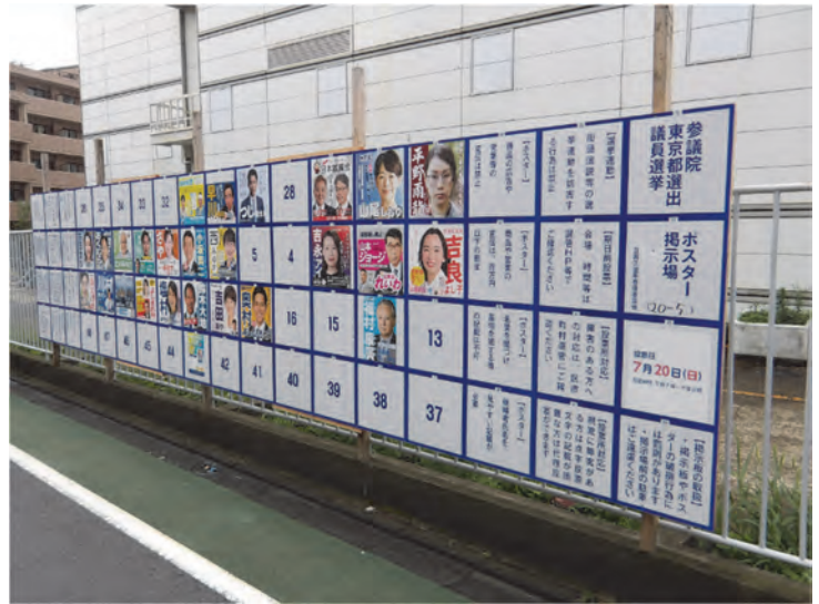
ポスター掲示場（参議院議員選挙）