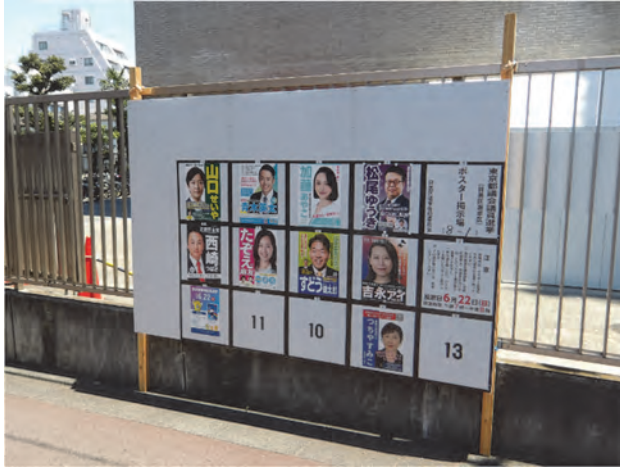
ポスター掲示場（東京都議会議員選挙）