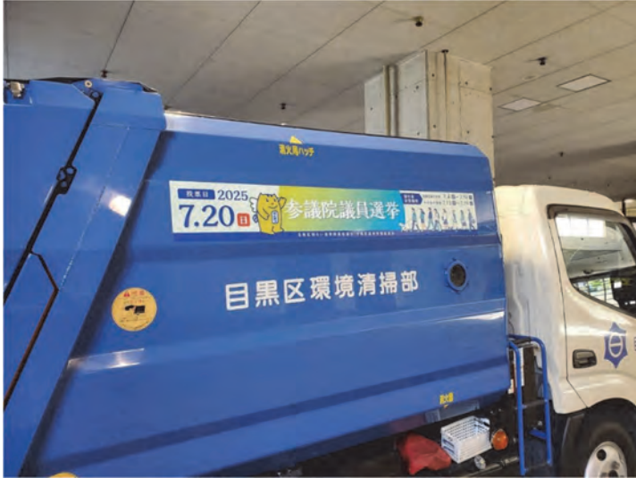
清掃車ステッカー（参議院議員選挙）