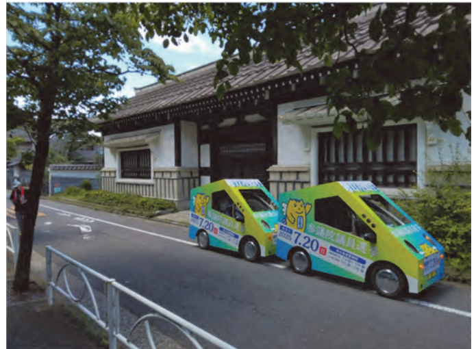
広告宣伝カー（参議院議員選挙）