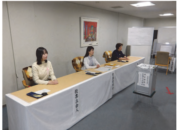
新有権者（左）の投票立会人（参議院議員選挙）