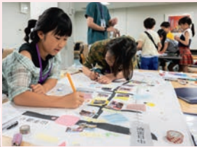
昨年の活動の様子

問子育て支援課子育て支援推進係（☎5722－8723、FAX5722－9328）