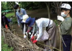
▲小枝で虫のすみかにもなるそだ柵作り