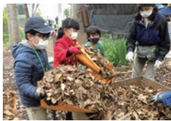
▲公園の落ち葉を使った堆肥作り