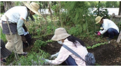
②公園内の植物で実習