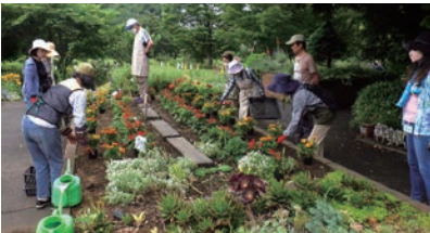
③修了後は学んだことを生かしたボランティア活動をスタート