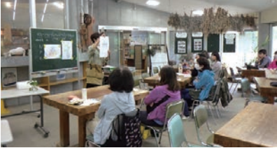
①循環型の園芸について学ぶ座学

☎2月28日から、区☎(コード②)、ハガキ(花みどり人講座と明記の上、住所、氏名(ふりがな)、電話、年齢を記入)で、3月20日(必着)までに、花とみどりの学習館(〒153-0061中目黒2-3-14 中目黒公園内)へ