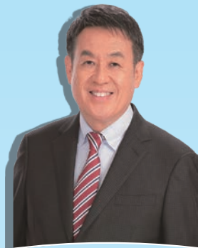
目黒区長 青木英二