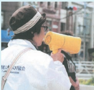
▲ガイドデビューの様子。洗足会館や三合塚などを回り、最後に宮野古民家自然園で栗ご飯を食べるコースをガイド