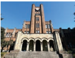
▲東京大学駒場地区キャンパス

東京大学駒場地区キャンパス、駒場公園、旧前田家本邸を巡りながら、駒場地域のバラの花を見るツアーです(ワイヤレスガイドを使用)。