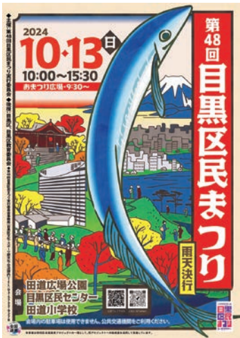
▶第48回ポスターデザイン

第49回目黒区民まっりを、10月12日(日)に開催します。 目黒区民まっりを参加者主体で盛り上げるため、ポスターデザインを募集します。採用作品は、10月に区内の全掲示板(1,500カ所以上)のほか、区内幼稚園・保育園、小・中学校、関係官公庁などに掲示します。また、パンフレットの表紙として使用します。 詳細は、区画をご覧ください。