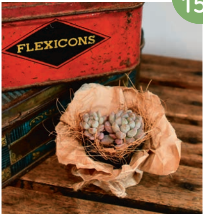
めぐろ区報 読者プレゼント