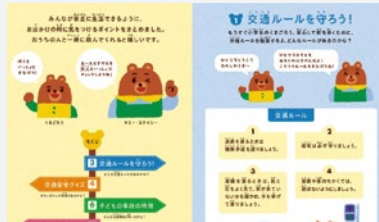
交通安全啓発絵本