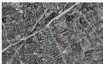
「空から見る学舎」昭和23年3月29日の旧第八中学校の場所