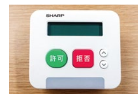
自動着信拒否装置